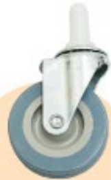
③自在キャスター ×2個