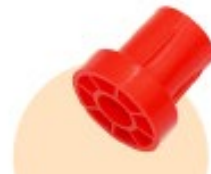
⑨キャスター受け ×4個