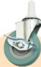
④自在キャスター (ストッパー付き) ×2個