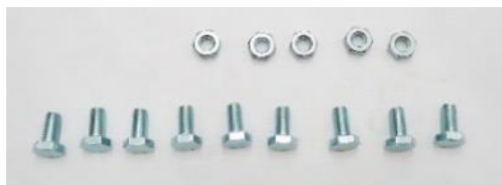
ボルト 9 本 / ナット 5 個